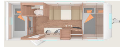
Weinsberg CaraOne 480QDK