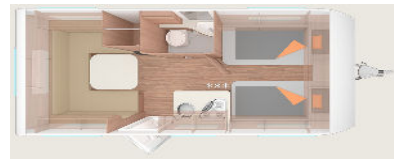
Weinsberg CaraOne 480EU