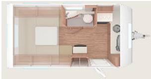
Weinsberg CaraOne 390PUH (mit Hubbett)