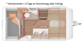
Weinsberg CaraOne 400LK