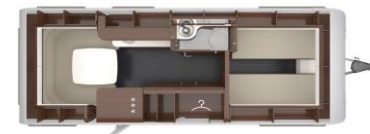
Tabbert Puccini 550E