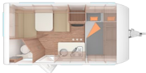
Weinsberg CaraCito 390QD1

* Wochenende = Freitag bis Montag ** Gesamtlänge inklusive Deichsel