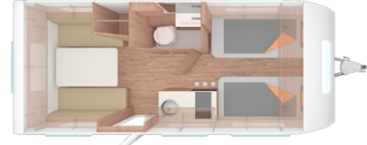
Weinsberg CaraCito 470EU