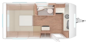
Weinsberg CaraOne 390PUH (Hubbett!)